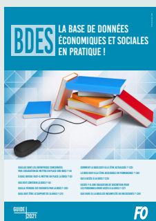
BDES – La Base de données économiques et sociales en pratique !

Ces guides sont élaborés par les secteurs de la confédération FO. Ils sont disponibles sur le site internet de la confédération ( force-ouvriere.fr ) ou sur demande par mail.