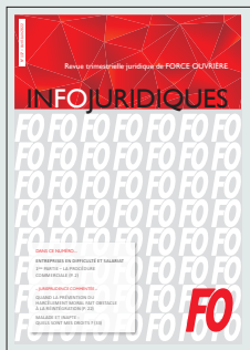
InFOjuridiques Revue trimestrielle juridique de Force Ouvrière

Contact : secteur de la Négociation collective et des Rémunérations – secretariatnego@force-ouvriere.fr