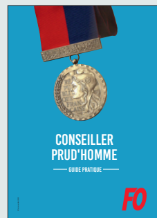
Conseiller Prud'homme – Guide pratique – À PARAÎTRE

Contact : secteur de l'Organisation et des affaires juridiques – sjuridique@force-ouvriere.fr