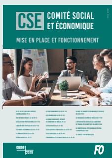
CSE – Comité social et économique Mise en place et fonctionnement