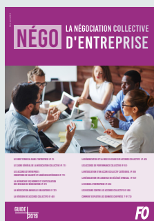
NÉGO – La négociation collective d'entreprise