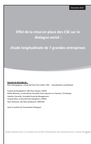
Effet de la mise en place des CSE sur le dialogue social : étude longitudinale de 7 grandes entreprises ?

Disponible sur : https://www.strategie.gouv.fr/sites/strategie.gouv.fr/files/atoms/files/rapport_effet_de_la_mise_en_place_des_cse_sur_le_dialogue_social_etude_longitudinale_de_7_grandes_entreprises_universite_paris_est.pdf