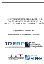
Le représentant de proximité : une figure au cœur des enjeux de la nouvelle représentation des salariés

Disponible sur : https://www.strategie.gouv.fr/sites/strategie.gouv.fr/files/atoms/files/rapport_effet_de_la_mise_en_place_des_cse_sur_le_dialogue_social_etude_longitudinale_de_7_grandes_entreprises_universite_paris_est.pdf