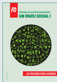
Climat et environnement : un enjeu social – Les positions de Force Ouvrière –

Contact : secteur de l'Organisation et des affaires juridiques – sjuridique@force-ouvriere.fr