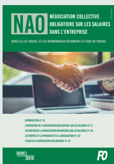
NAO – Négociation collective obligatoire sur les salaires dans l'entreprise