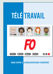
Télétravail – Guide d'appui à la négociation dans l'entreprise –

Contact : secteur de l'Organisation et des affaires juridiques – sjuridique@force-ouvriere.fr